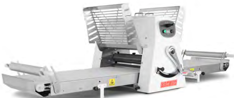
SIRIO 500 BANCO

E Las máquinas están montadas sobre ruedas, per facilitar el movimiento